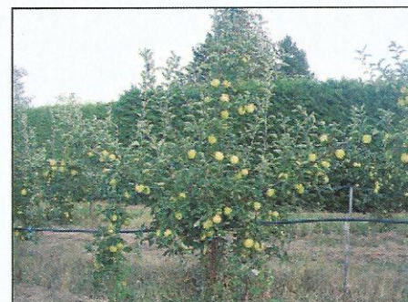
Photo 2 - Récolte en 5 ème feuille